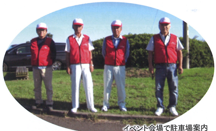
イベント会場で駐車場案内