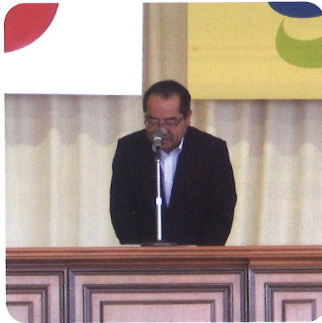
大島東与賀支所長