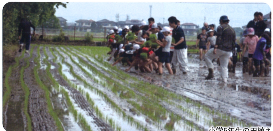
小学5年生の田植え