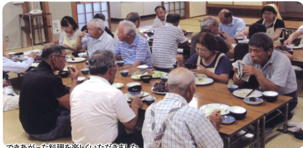
できあがった料理を楽しくいただきました。