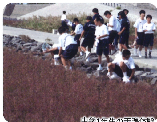
中学1年生の干潟体験