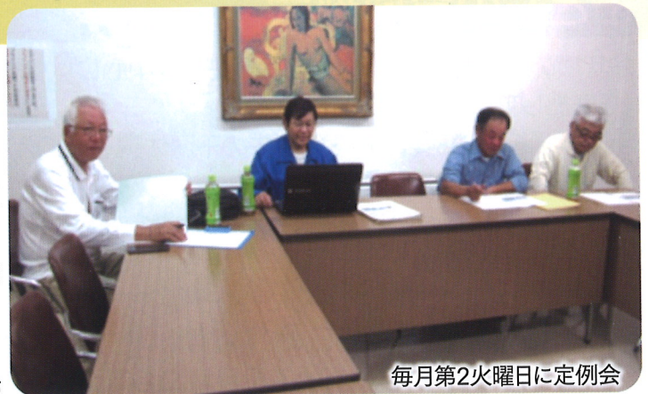
毎月第2火曜日に定例会

それから、町内のイベントに於いて駐車場の案内係や、今度の冬休みには部会員全体での見守り活動を計画しています。