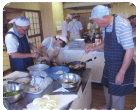
慣れない手つきで大変でした。