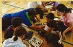
名前を調べています