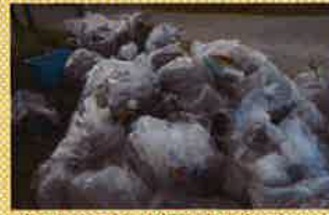
多くのごみが回収されました