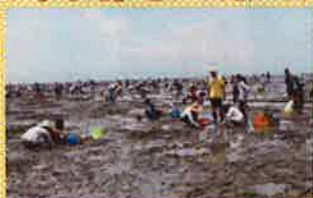
マジャク釣りの様子

7月22日に荒尾マジャク釣り大会が開催されました。夏の日差しが厳しい中、県内外から約900人の参加がありました。筆を使ったマジャクとの駆け引きはまさに真剣勝負で、巣穴からマジャクを釣りあげた参加者の歓声が干潟に響いていました。参加者から、「筆を使う独特の漁法は面白くて、夢中になってしまいました」といった声が聞かれました。