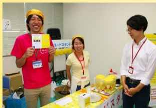
レモネードスタンド