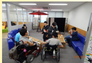
チャリティお茶会