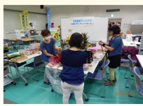
フラワーアレンジ ブルローズ