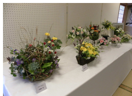
フラワーアレンジ ローズキューブ