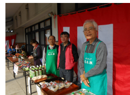
手作り雑貨等の販売