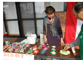
手作りのアクリルたわし