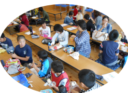
昼食はおにぎり弁当