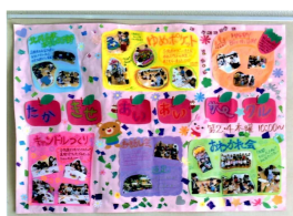
あいあいサークル