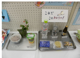
食生活改善推進協議会