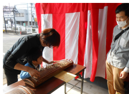
文化等の演奏体験