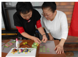
寒冷紗の花 製作体験