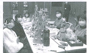
るんるん♪クリスマス