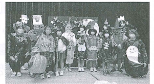
るんるん♪ハロウィン

今年度は「るんるん♪運動会」「るんるん♪ハロウィン」「るんるん♪クリスマス」「るんるん♪宝探し」という内容で、富士町内の子どもと大人と一緒に季節の行事を楽しみました。体験活動を通して関係づくりも進み、子ども達からは、「ほめられてうれしかった」「みんなで協力してできて楽しかった」などの感想が聞かれました。