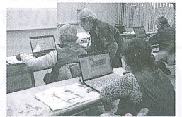
パワーポイント基礎講座

行政手続きのオンライン化など社会全体のデジタル化が進む中、少しでもデジタルが身近で使いやすいものとなるよう“ばそこん講座(全7回)”と“ICTお困りごと相談会”を実施しました。ばそこん講座ではマイナンバーカードの申請、年賀状の作成、現金出納簿の作成等いろいろなジャンルに挑戦しました。この講座を通して町民のICTの利活用が進んでいくことを願っています。