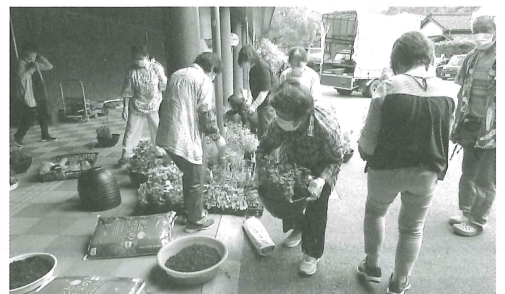
※たくさんのお花苗の中から寄せ植えの苗を選ぶことができます。(令和4年度の講座の様子)

講座等の日程は講師の都合及び天候によって変更する場合がありますのでご了承ください。