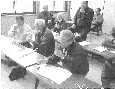
牛乳パックで笛を作りました！