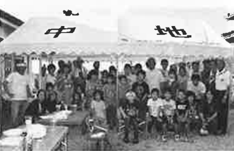
2019パーベキュー大会 集合写真

「地蔵まつり」から未来へ みなでつくるやさしい町 中地公民館の敷地内にはふたつの石碑と地蔵さんが鎮座しています。その昔、疫病が流行った江戸時代にお地蔵さんを祀って「地蔵まつり」が始まったと伝えられています。その後、毎年8月23日に行っていました。昭和初期に途絶えてしまいました。しかし、当時から行っていた「おこもり(千灯籠)」は現在も形を変えて引き継がれています。毎年、蓮池町民運動会の後、「おこもり」をかねて皆が中地公民館に集います。昔からずっとこの土地で暮らしている人、一旦町外にでて戻ってきた人、新たにこの土地で暮らし始めた人、色々な暮らしの人々を皆が分け隔てなく優しく迎えています。 子どもたちも多く暮らすようになり、また、一昨年の夏は、三夜待主催で子ども世帯を対象にパーベキュー大会を実施しました。町区のテントが寄付されたお披露目を兼ねて、子ども達が元気で助け合って過ごして欲しいとの思いで実施されました。 敷地内のお地蔵さんのお世話は「二十三日さん」と呼ばれる昔ながらのメンバが行っています。仲間は少なくなりましたが、蓮池町にコロナが広がりにくくするように、どの願いを込めて、お花を供えて手を合わせてい「す」と話していただきました。