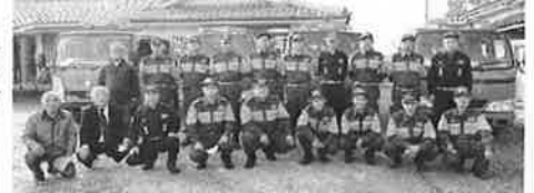
蓮池町消防団のみなさん