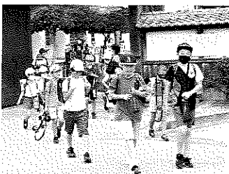
元気に下校する児童たち

通学路における児童・生徒の安全を守るため、事故を未然に防止するための対策の一つとして「子どもお守り隊」では、活動を行っています。