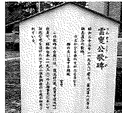
新しくなった説明版 雲叟公歌碑 (うんそうこうかひ)

蓮池公園は、旧蓮池藩の居館のあった場所を明治10年頃に公園に整備されました。園内には、歴史的な記念碑や句碑など説明看板が設置されていますが、支柱が老朽化し、説明板も色あせていました。このほど佐賀市緑化推進課が説明看板を新しく取り替えました。これから桜の季節を迎えます。皆さん是非、蓮池公園へ足を運ばれてみてください。