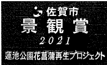
蓮池公園に設置された 景観賞の銘板

令和3年度佐賀市景観賞を受賞した「蓮池公園花菖蒲再生プロジェクト」に景観賞銘板が贈られ、蓮池公園内に設置されました。まちづくり協議会（自然と環境を考える部会）が中心となり地元有志が公園北側の水路沿いに約10年ぶりに開花させ地域活性化につなげた点が受賞理由となりました。