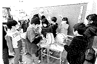
小松浮立に使う道具に 触れました