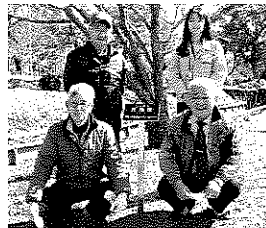
銘板の前で まちづくり協議会の皆さん