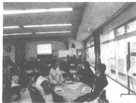
ワークショップ（座談会）