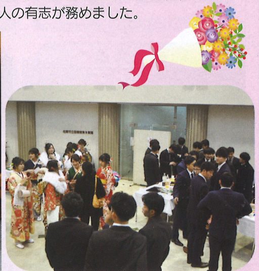
立食ティーパーティー