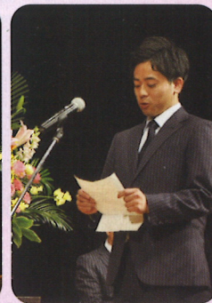
誓いを述べる新成人