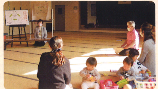
子育てサークル「よかよかサークル」1/13(水) 東与賀保健センター