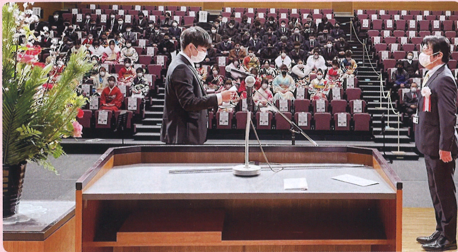
誓いを述べる新成人