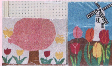
デイサービス東与賀