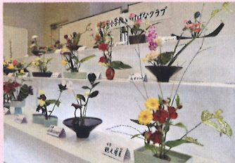
東与賀小学校いけばなクラブ