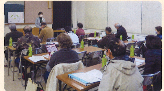
まちづくり協議会 定例会 1/19(火) 改善センター