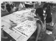
(写真は昨年の様子)