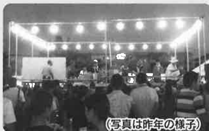
(写真は昨年の様子)

・会場に駐車場はありませんので、徒歩もしくは自転車でお願いします。 ・公園敷地内は、全面禁煙です。