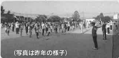
(写真は昨年の様子)