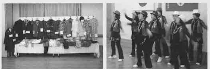
一昨年の文化祭の様子