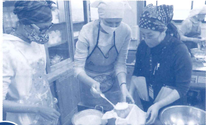
4月 ウクライナの皆さんと豆腐づくり