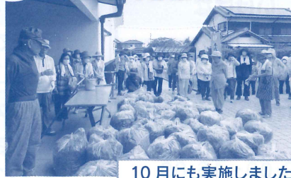
5月 公民館除草作業