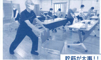
6月 下肢筋力測定会