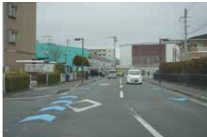
【藤木 佐賀清和学園正面前交差点南周辺】