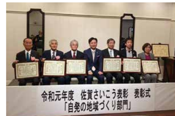
【受賞した6団体の代表】

2月15日開催の佐賀さいこう表彰（自発の地域づくり部門）は今年が初めての実施。これは自立して活動を続ける町おこし団体などを佐賀県が表彰するもので、県内一円から特色のある取り組みを続ける6団体の一つとして表彰されました。