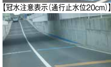
【冠水注意表示(通行止水位20cm)】

市道大財藤木線JR地下道は、昨年大雨時に冠水し車の水没もありましたので、20cmの通行止水位（青線）表示してあります。