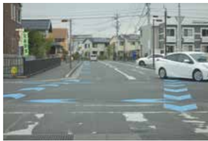
【西中野 セブンイレブン南西交差点より北を望む】

佐賀清和学園正門より南に行く市道は、道路幅が狭くJR踏切もあり朝夕の通勤、通学時は交通安全に危険であるとして自転車左側通行の▲型の路面標示を設置して頂きましたので交通安全につとめましょう。