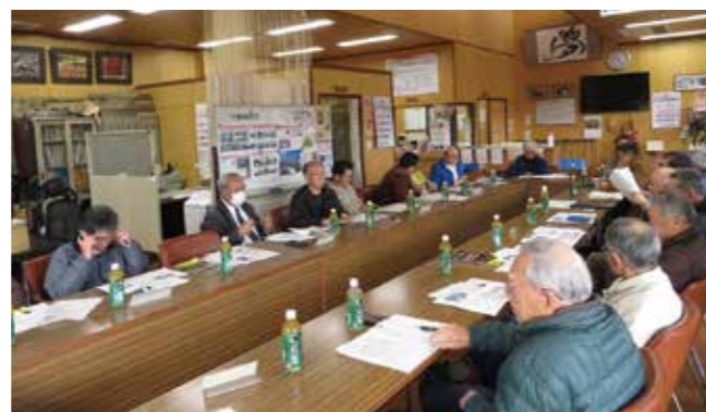
【まちづくり会議の様子】

今後、ゆめタウンを基地にして何らかの訓練開催について、地区内で災害時防災協定を締結した企業などを交えて検討する事が確認されました。