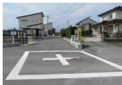
【完成した標識と交差点内の白線】

なお、道路に引かれた白線や安全確認を行う制止線の引き直しなども要請し完了しました。同時に全体的に横断歩道や白線の薄れた箇所がありましたが、このところ着々と補修が進み非常に確認しやすくなりました。児童生徒の安全に一役買ってくれることでしょう。