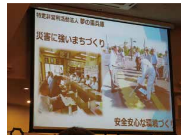
【会場では活動を紹介】