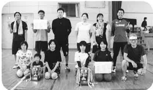
材木町、大財六丁目Aの選手のみなさん