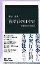
親孝行の 日本史 勝又基