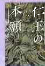
仁王の本願 赤神諒