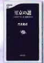
東京の謎 門井慶喜