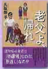
老父よ帰れ 久坂部羊