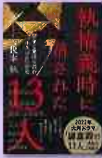
執権義時に 殺された13人 榎本秋