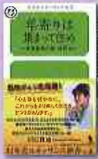
年寄り集 集まって住め 川口雅裕