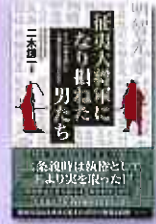
征夷大將軍に なり損ねた男たち 二木謙一