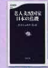
老人支配国家 日本の危機 エマニエル・トッド