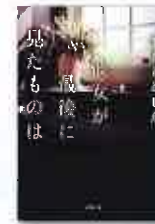
彼女が最後に 見たものは まさきとしか