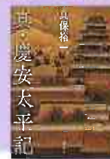
真・慶安太平記 真保裕一