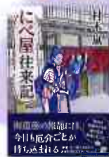
にべ屋往来記 村木嵐