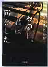
あの日は 何をした まさきとしか