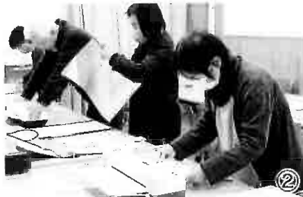
② 町なかに飾るため、短冊1つひとつに防水のためパウチ加工を施します