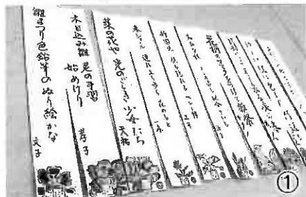
① 応募作品は、絵手紙サークルさんの挿絵と書道サークルさんの消書により短冊になります