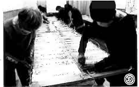
③ 短冊が等間隔になるように、丁寧に紐でつなぎ合わせます

→ 展示作業④～⑨ → 杭や柱を立て、短冊を結び付けます。八坂神社、肥前通仙亭、松原神社東側の3か所に分かれ、約2時間の作業です