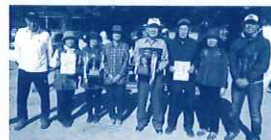
[団体] 1位・2位の皆さん