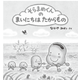
そらまめくんのまいにちはたからもの なかやみわ 著