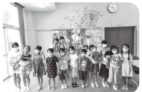
みんなで素敵な七夕飾りを作りました☆