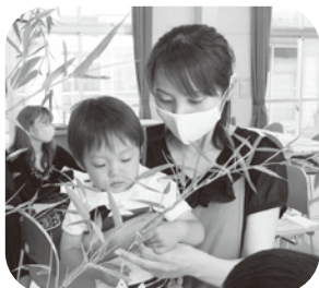
願いがかないますように☆