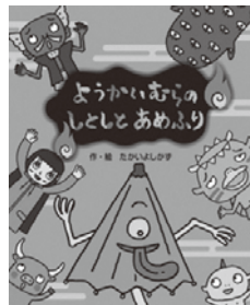
ようかいむらのしとしとあめふり たかいよしかず 著