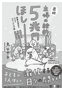
主婦の給料、5兆円ほしー!!! 家事も育児もさらにパワーアップ編 鳥谷丁子 著