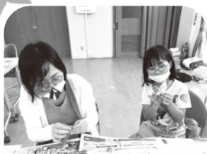
親子参加で楽しそう☆