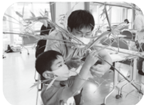
どこに飾ろうかな☆