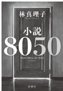
小説8050 林 真理子 著