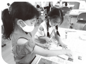
短冊を作っています☆

6月30日（水）に、小学生を中心に七夕飾りを作りました。事前に地域の方が用意して下さった笹竹に、願い事を書いた短冊や、折り紙で作ったリング、色を塗ったすいかなどを飾り、素敵な七夕飾りができました。