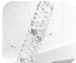
開成の天の川も登場☆