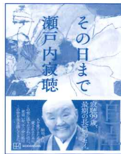
その日まで 瀬戸内 寂聴：著