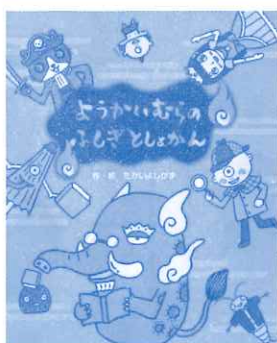
ようかいむらのふしぎ としょかん たかいよしかず 著