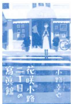
花咲小路二丁目の寫眞館 小路 幸也 著