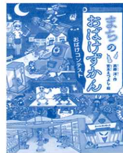
まちのおばけずかん おばけコンテスト 斉藤 洋 著