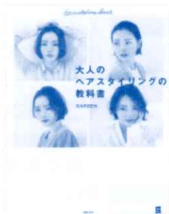
大人のヘアスタイリングの教科書 GARDEN 著