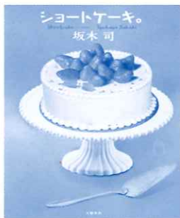
ショートケーキ。 坂木 司 著