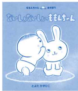
ないしょないしょのももんちゃん とよた かずひこ 著