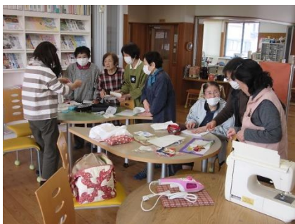
マスクづくり講座

今年度の公民館運営方針や講座等について、公民館職員が報告します。来年度の公民館運営に活かすため、地域の皆様のご意見をきく時間も設けます。多くの皆様の参加をお待ちしています。