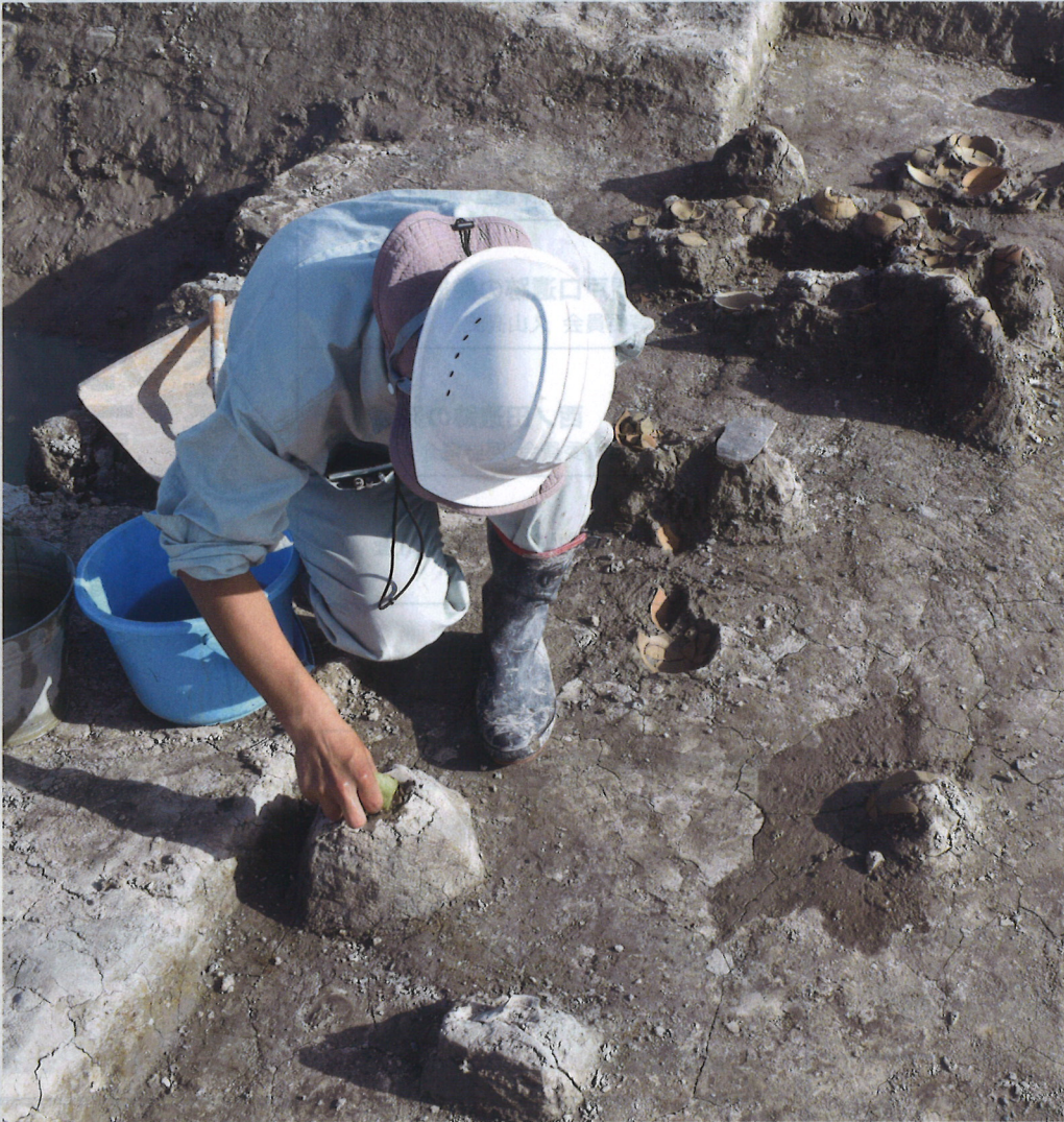
藤三郎屋敷(佐賀市)の発掘調査の様子