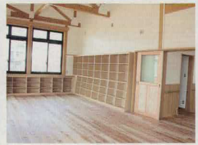
図書・フリースペース