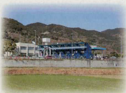
佐賀大和インターチェンジ