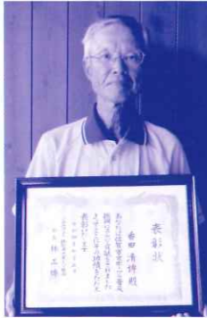
表彰状を手に記念撮影

今回の受賞について、「一生懸命やれば必ずいいことがあると信じてソフトボールの発展に全力を尽くしてきました。今の目標はSAGA2024国スポで審判をすることで」と意気込んでおられます。