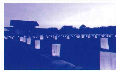
願いごとを書いた紙灯ろう

最後に、イベント開催にあたり多くの皆様にご協力をいただきました。心より感謝申し上げます。