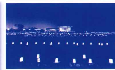
幻想的な灯が広がります