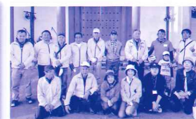
ほのかPを支えた皆さん