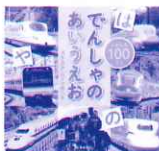
「しゃしん100てん でんしゃのあいうえお」