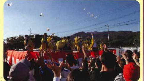
2回目餅投げ 校区団体代表