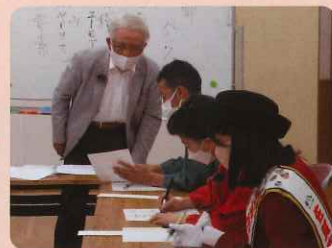
収録の様子です 11月9日(水)のテレビ番組「かちかちPress」で放映されました