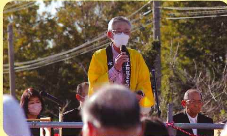
建設検討委員会 社会長挨拶