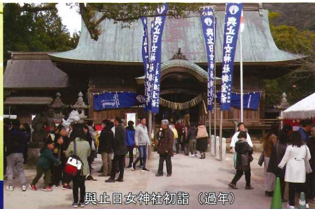
奥止目女神社初詣(過年)

佐賀市の人口 229,499人 川上校区の人口 5,746人 川上校区の世帯数 2,206世帯【令和4年11月末現在】