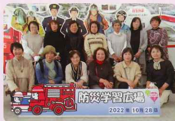
消防局で記念写真