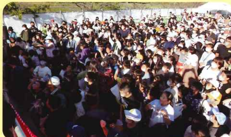
空に舞う餅を両手で受け止める参加者