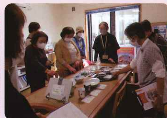
在宅生活サポートセンターにて