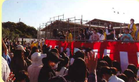
1回目餅投げ 小学生とPTA代表