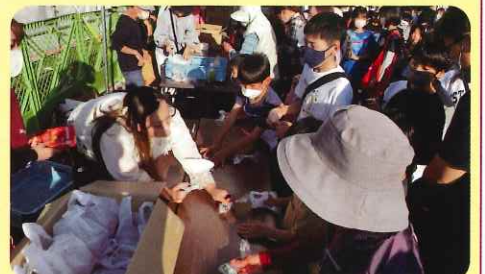
景品交換に行列が出来ました