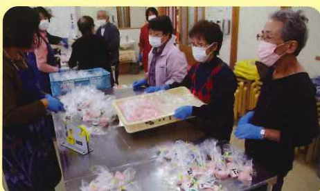
女性で朝から餅を袋に入れる作業を