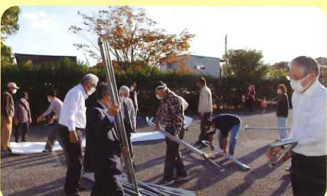
後片付けも全員で協力して