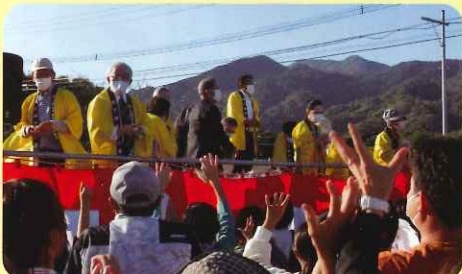
3回目餅投げ 建設検討委員・来賓