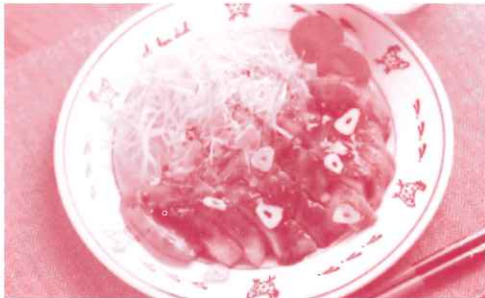
鶏むね肉のトンテキ風