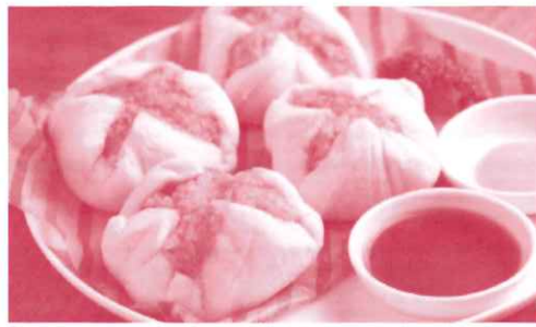
食パンと電子レンジで簡単肉まん