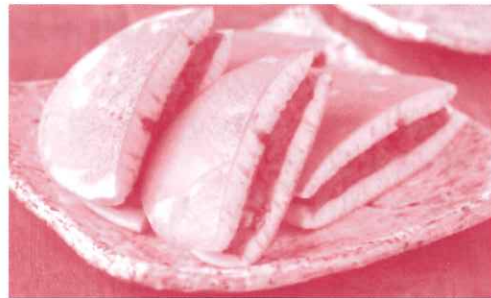
フライパンで作るどら焼き