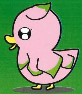
巨勢コッコちゃん