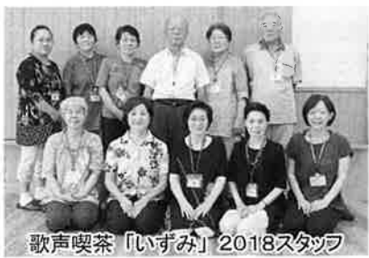
歌声喫茶「いずみ」2018スタッフ

「恋の季節」を縦わりて輪唱したり、新しいことにも挑戦しました。この2曲は来月までの宿題なので、時々自宅でも練習してみてくださいね。