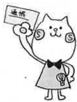
佐賀市口座振替キャラクター「よかねこさん」