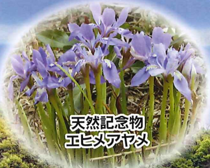
天然記念物 エヒメアヤメ