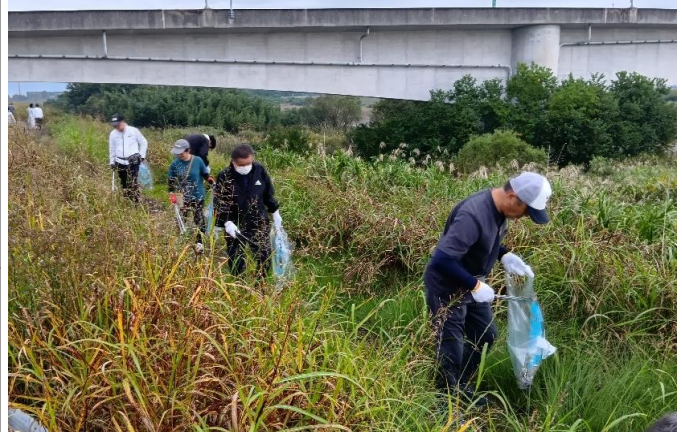
地元建設業者や自治会など約100人が嘉瀬川河川敷周辺のごみ拾いを行いました(10月25日)