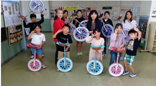
佐賀県一輪車協会と佐賀県一輪車クラブ保護者会が、思斉館小学部に一輪車10台を寄贈しました(10月20日)