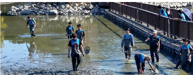
森林公園の自然池の水位を下げて水質を改善する池干しがありました(11月8日)