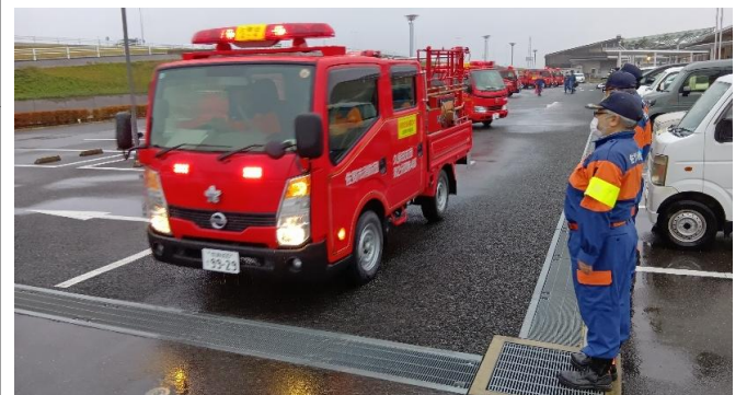
佐賀市消防団南部方面隊久保田支団の秋季防火パレードがありました(11月9日)

お問い合わせ先：久保田まちづくり協議会 事務局 ☎0952-68-3130 久保田町内のイベントで取材に伺います。