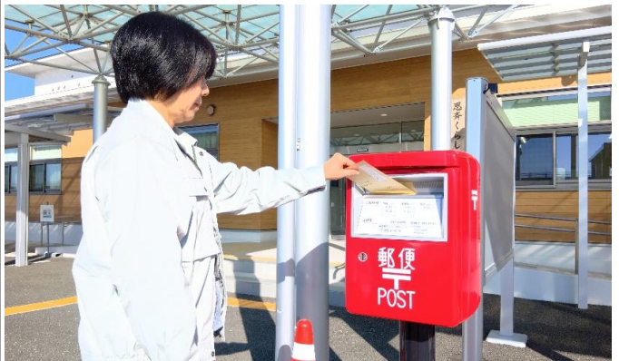
らーめん竹ちゃん久保田店前に設置されていた郵便ポストが、思斉くらし総合センター前に移設されました！ぜひご活用ください。