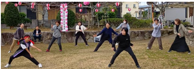
桜木自治会が創立30周年を迎えました。ステージイベントやくす玉割りなどで盛り上がりしました(10月25日)