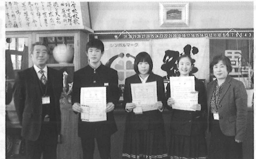
中学部のみなさん