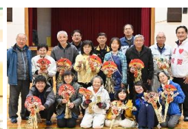
久保田校区社協の しめ縄づくり教室 (12/13)