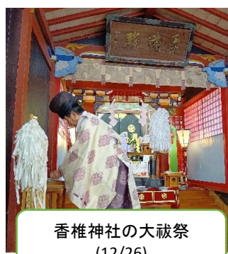
香椎神社の大祓祭 (12/26)