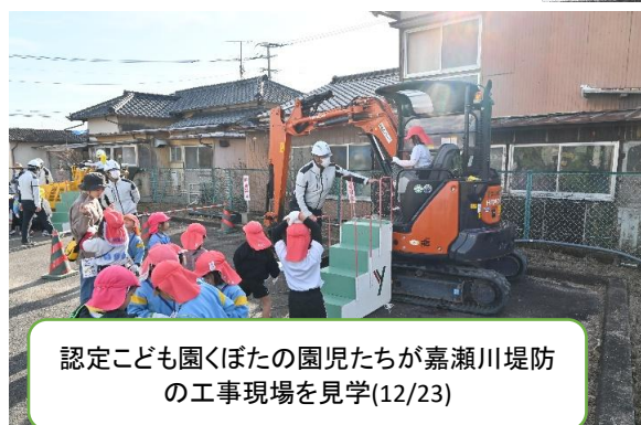
認定こども園くぼたの園児たちが嘉瀬川堤防 の工事現場を見学(12/23)