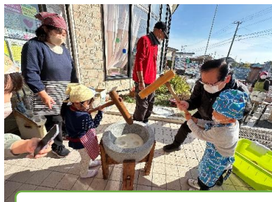
久保田保育園の餅つき(12/10)

令和8年が幕を開けました。町内の各自治会などでは、年末年始にかけて正月行事がありました。久保田保育園や上恒安で餅つきがあり、久保田宿では地元の神社に飾るしめ縄が作られました。また、久保田校区社会福祉協議会も恒例のしめ縄づくり教室を開きました。香椎神社では年末に大祓祭、年明けには元旦祭があり、多くの参拝客が訪れました。