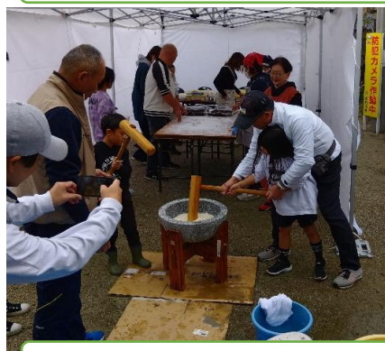
上恒安の餅つきと王子の森神社のしめ縄作り(12/21)