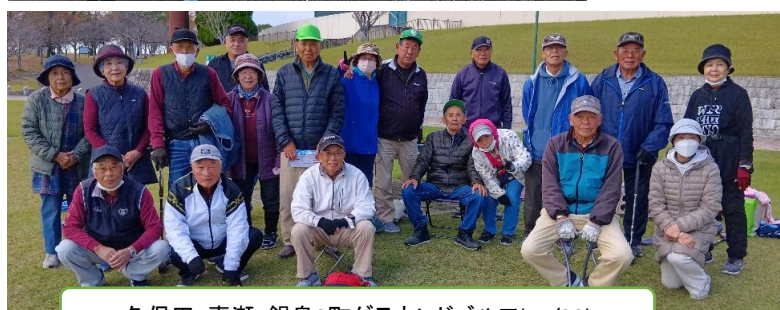
久保田・嘉瀬・鍋島3町グラウンドゴルフ(11/20)