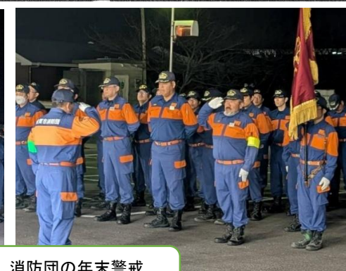
消防団の年末警戒 (12/29~30)