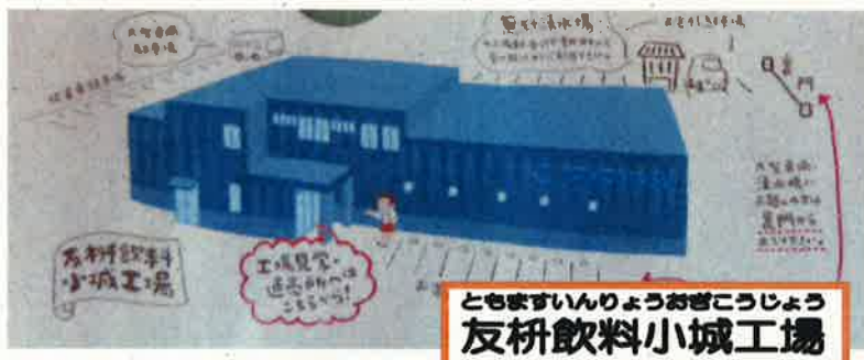
ともますいりょうおきこうじょう 友研飲料小城工場