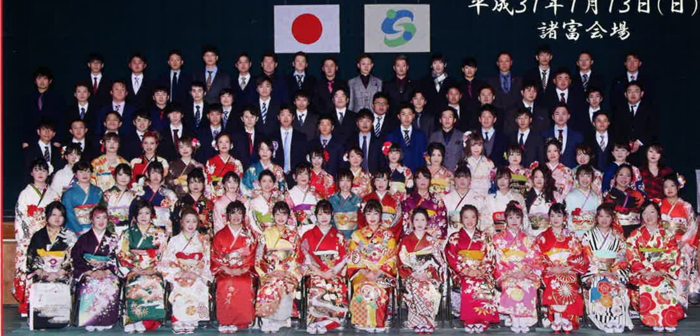
諸富校区では、95人の方が新成人となられ、新たな一歩を歩み始められました。 今後のご活躍を祈りいたします。