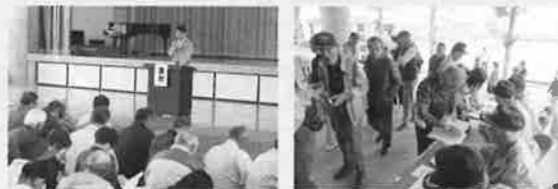
洪水への備えについて