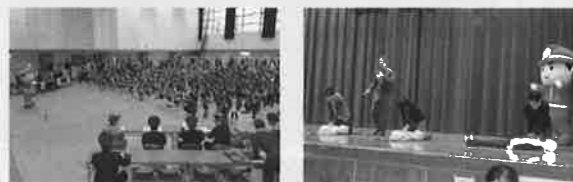
幼少年消防クラブの皆さん

火災の無い明るく住みよい町の実現と防火意識の高揚を図ることを目的とした「防火のつどい」が諸富町公民館で開催されました。幼年消防クラブの幼児による可愛いお遊戯で盛り上がった後は、消火訓練や救急講習に真剣に取り組み、最後は防火宣言で締めくくりました！あいにくの雨で、はしご車体験乗車や消防自動車資器材の展示は中止されましたが、消防クイズや風船コーナー、煙中体験コーナー、VR消火体験コーナーなど楽しみながら学ぶことができました！