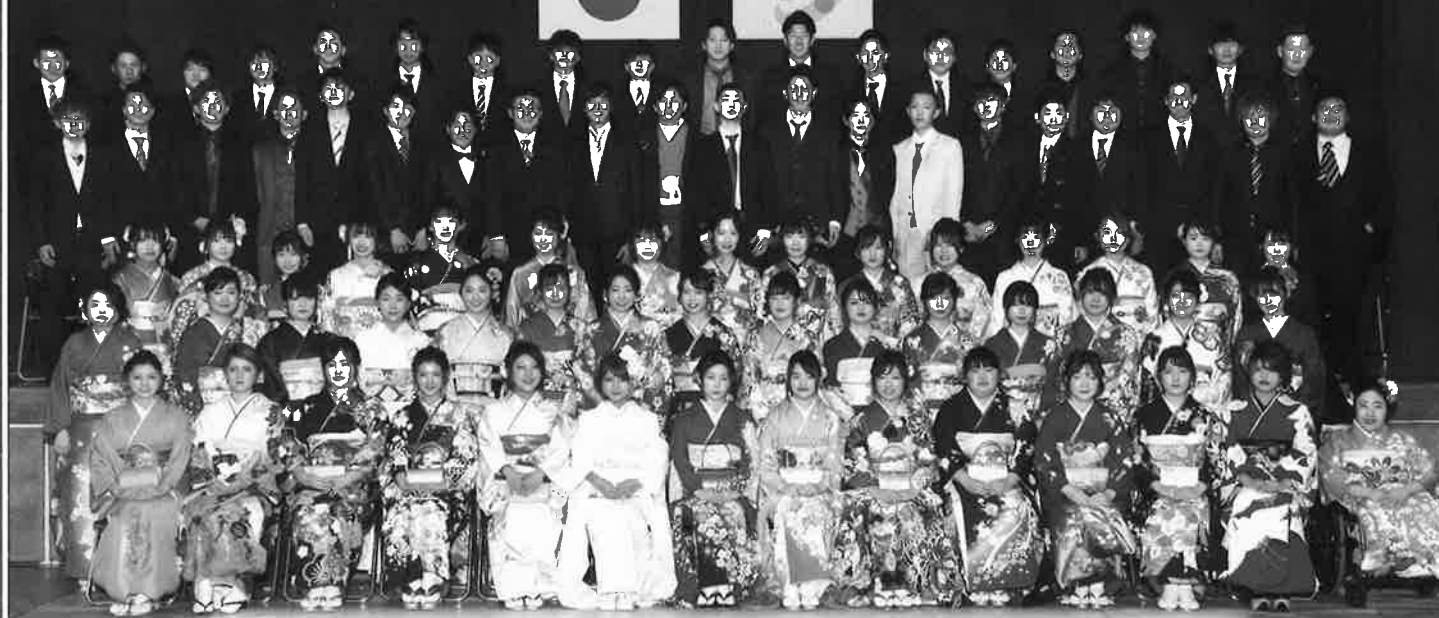
諸富校区では、97人の方が新成人となられ、新たな一歩を歩み始められました。今後のご活躍をお祈りいたします。