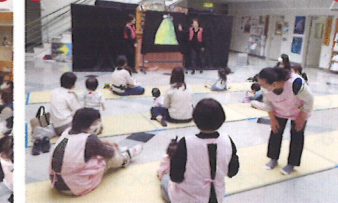
「がらがらどん」のお話の部屋