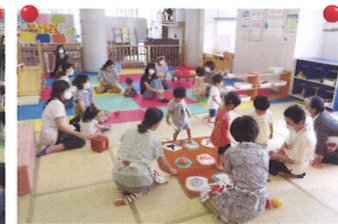
布おもちゃであそぼう