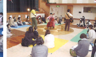
劇団風の子の舞台