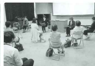
「よだかの星」の朗読