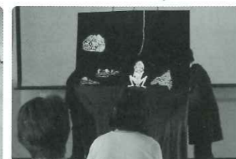
ブラックシアター