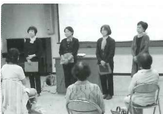
リーフのみなさん