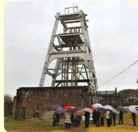
宮原坑・第二堅坑槽

三池炭坑関連資産である万田坑、宮原坑に行ってきました！行きのバスの車内で炭坑の歴史や炭坑労働者、囚人が強制連行され人権を無視された労働環境などを学びました。万田坑、宮原坑では日本の近代化に向けた歴史を体感することができ、充実した研修となりました。