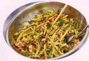
ジャガイモとチキンの梅サラダ