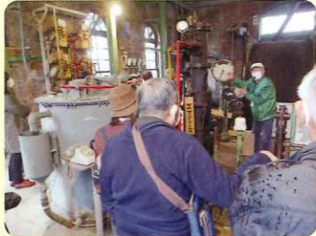
万田坑・第二堅坑巻揚機室