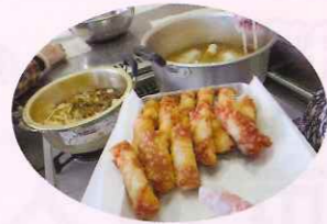
もちジャガチーズのミニ春巻き