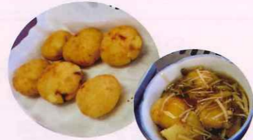
ジャガイモ饅頭のキノコ餡かけ