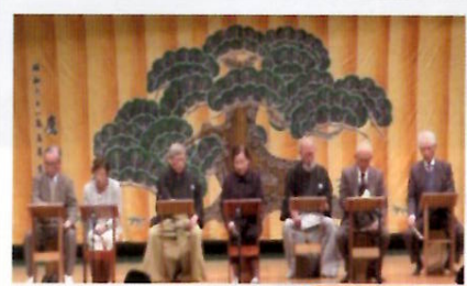
発表・展示会場の様子