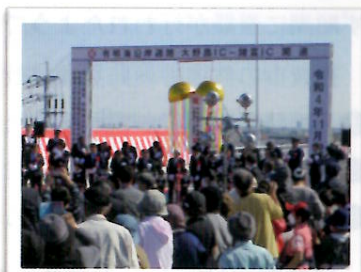
ウォーキングと有明早津江川大橋・開通式