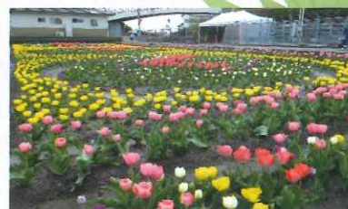
諸富花いちもんめの会