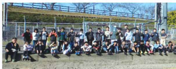
植栽終了後の集合写真(諸富北小学校5年生)