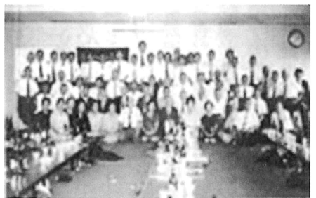
昭和50年商船学校同窓会 於 旧中川副公民館

今月は、佐賀商船学校の同窓会（2）を紹介します。 商船学校の慰霊祭は、早津江の妙楽寺で開催され、同窓会は寄宿舎があった（旧）中川副公民館と妙楽寺で開催されました。私が、三重津海軍所跡で佐賀市内のS夫婦をガイドしている時（平成29年7月）、父が商船学校の卒業生であることを話されました。三重津海軍所は、明治政府になると廃藩置県とともに建物が壊され、何もなくなりましたが、佐野常民の海軍に対する強い思いで、明治35年（1902年）、三重津海軍所跡に佐賀商船学校が設置されたことなど、商船学校の歴史の説明を行いました。その後、父の思い出の商船学校時代のアルバムを持って来られ、慰霊祭の場所、同窓会の場所の確認ができ、妙楽寺に案内しました。妙楽寺から慰霊祭の日（9月23日）にお参りに来られたら慰霊祭をしてよいと快く言われ、現在もS夫婦は、毎年お参りをされています。これが、歴史ガイドをしての縁だと思っており、大切にしたいと思います。