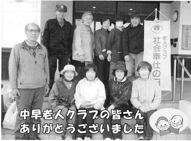
中早老人クラブの皆さん ありがとうございました