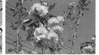
中川副公民館の八重桜