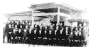
中川副中学校落成記念

また、学制の改正により、明治22年、川副郷一円(北川副、東川副、新北、大詫間、中川副、南川副、西川副)の7か村による川副高等小学校が現在の中川副小学校の北部の福富村に設置され、大正5年の廃校に至るまで27年間にわたり卒業生3,444名を送り出しました。その後、昭和22年の新学校制度(6・3・3・4制)により、中川副小学校の隣に中川副中学校が開校し、昭和34年の川副中学校竣工に伴い、川副中学校へ移転しています。このように中川副が教育の中心地で、場所は、福富村であることがわかります。